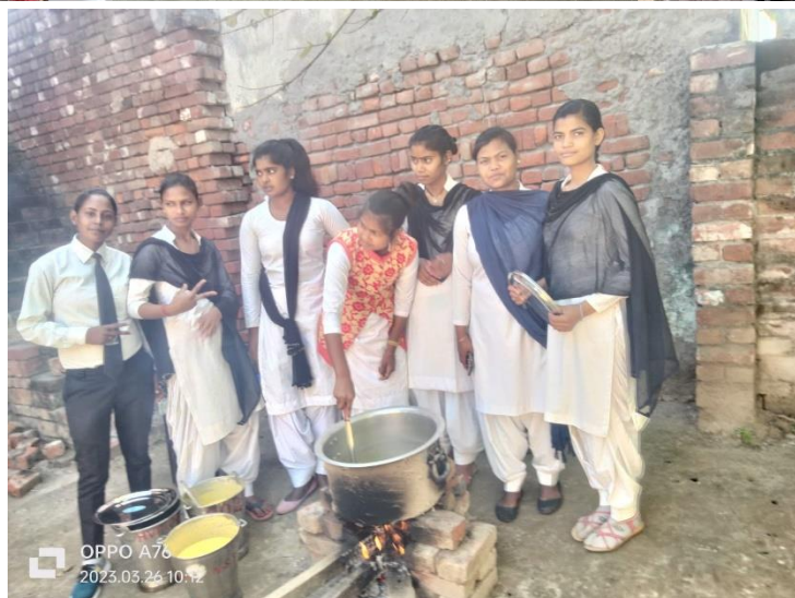
OPPO A76 2023.03.26 10:12