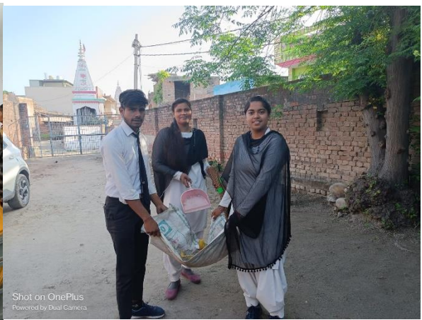
Shot on OnePlus Powered by Dual Camera