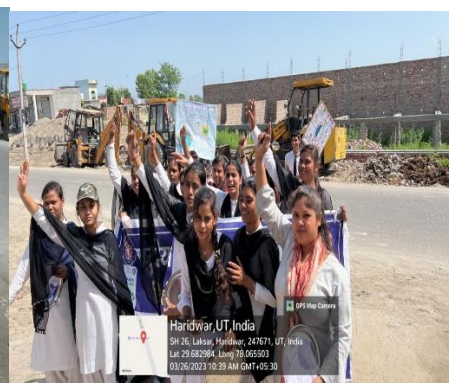
Haridwar, UT, India SH 76, Laksar, Haridwar, 247671, UT, India Lat: 29.682964, Long: 78.055903 03/26/2023 10:39 AM (GMT+05:30)